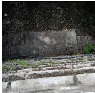
电梯已拆除

快报讯(记者 孙玉春)今年7月19日,现代快报报道了武定门城墙电梯的“尴尬”现状。自2008年该电梯建成后,因为涉嫌违反城墙管理法规被文物管理部门叫停,实际上并未使用。8年过去了,电梯老化。记者昨天获悉,这处尴尬的设施终于在日前被相关部门拆除。