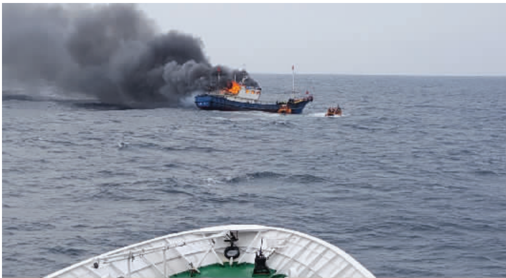
这是9月29日在全罗南道新安郡附近海域拍摄的起火的中国渔船

据韩联社援引韩国木浦海洋警备安全署的消息报道,一艘中国漂网渔船9月29日上午在韩国海域起火,3名船员死亡。中国驻光州总领事馆官员对新华社记者表示,目前正在了解相关情况。