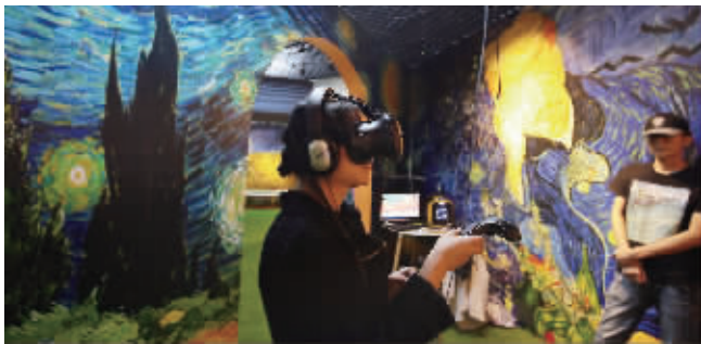
戴上VR眼镜,感受最新科技