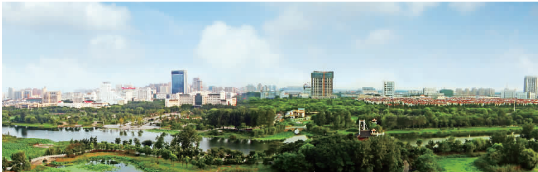
生态城市 绿色宿迁