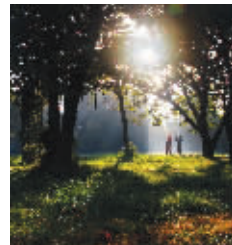
古栗林之晨