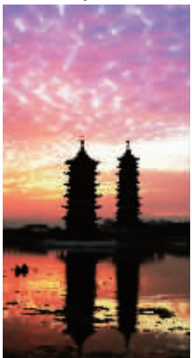
双塔晨曦