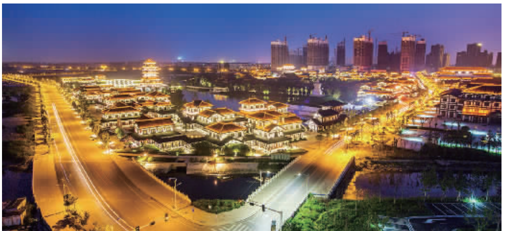
改造后项王故里景区夜色辉煌