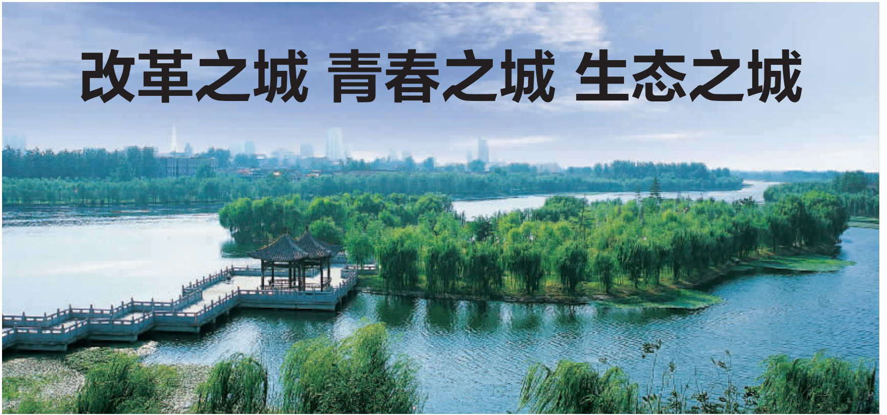
黄河风光带