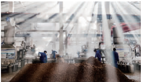
美酒酿造者