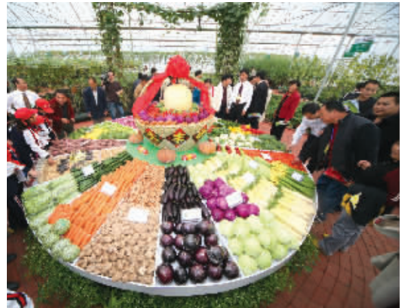
大丰收“拼盘”观者如织