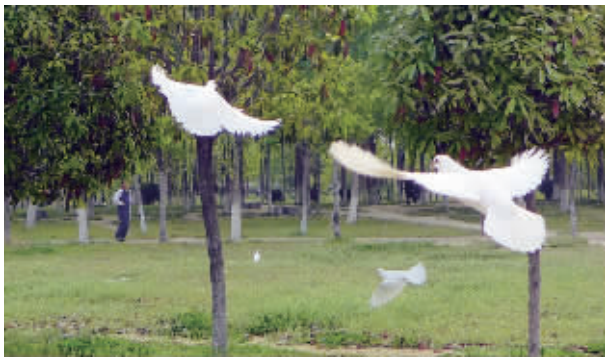
宿豫区千岛园广场