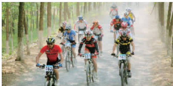
林海角逐