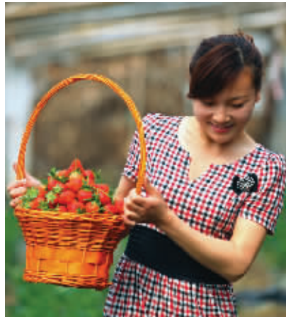
村官的喜悦 沐阳