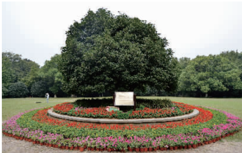
金陵桂花王