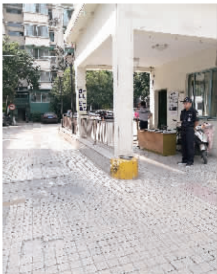
金陵世家小区门口有两家物业公司的保安在值班