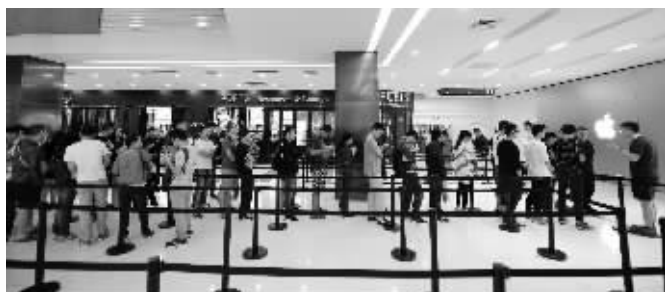
iPhone7昨天开售，现场排队的人群

昨天上午，现代快报记者来到了中山路上的苹果直营店看到，前场可供市民参观，后场和二楼层则仅供预约用户领新机、付费。这些预约用户需要先在店外的商场内排队，在工作人员的引导下依次进入店内。不过，跟以往苹果发售新品相比，这支队伍显得不长。“今天全国发售的所有iPhone7都仅针对预约客户，没有多余的新手机可以让用户现场购买。”工作人员告诉记者。