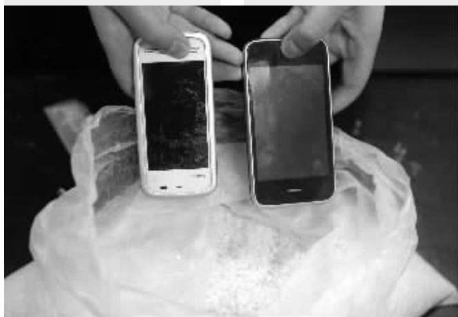
两部手机在大米里“躺”了48小时后，仍无法开机