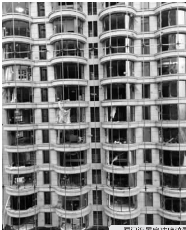
厦门海景房玻璃碎裂