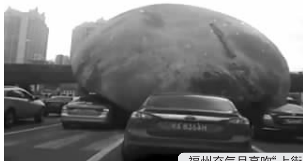
福州充气月亮吹“上街”