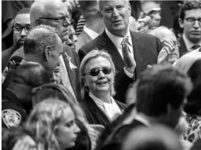
被众多政要簇拥在中间的希拉里

不少人因此提出两大质疑:作为角逐总统宝座者,希拉里的真实健康状况如何?诚信口碑如何?