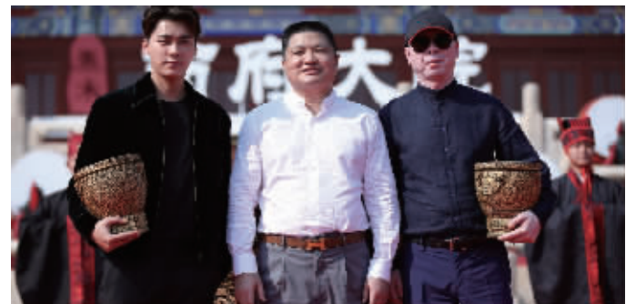
冯小刚、李易峰、黄其森组成“皇家礼炮”组合,见证泰禾西府大院全球首发

而在私密上,泰禾采用的是英国管家式服务,管家是需要的时候马上来,不需要的时候你不要打扰我,可以说不仅仅有私密性,更有尊严感。此外,还会有院墙、园林等各方面设计保证业主的私密性。