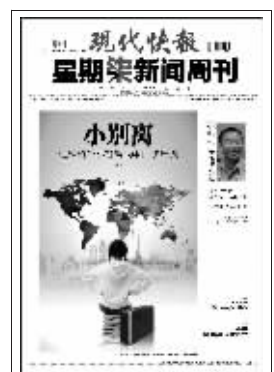
上期星期天新闻周刊封面