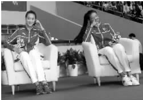
惠若琪、张常宁主讲南师大开学第一课