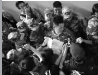
同学们太热情,王嘉男“艰难”离场

“遇到瓶颈期你们如何应对?”“这么高的个子,有没有什么困扰?”……开学典礼后的“德风大讲坛”,掀起一轮互动问答高潮。而每一位提问的同学,都会跟自己的偶像来一个大大的拥抱。