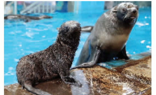
小海狗和妈妈

快报讯(记者 徐红艳)古代神话中李靖的夫人怀胎三年零六个月后,生下哪吒。在南京海底世界极地馆,也有一个“小哪吒”,在海狗妈妈Liti肚子里呆了15个月才呱呱坠地。昨天,小家伙迎来了满月,工作人员和不少游客一起为它庆祝。