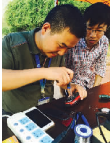
南京高等职业技术学校老师帮居民修东西