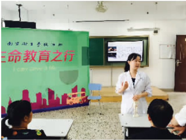
南京卫生学校老师给居民授课