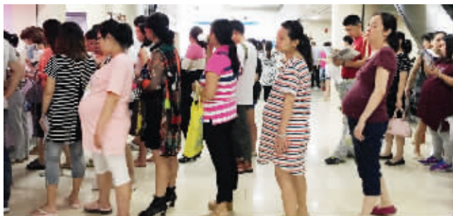
一大早,南京市妇幼保健院就有不少孕妇排队挂号做产检