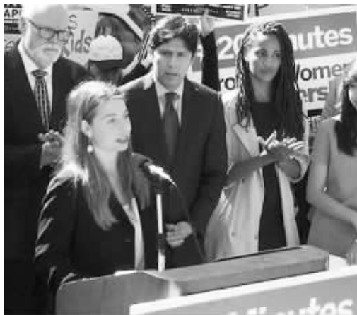
监狱外的抗议者称法官不公