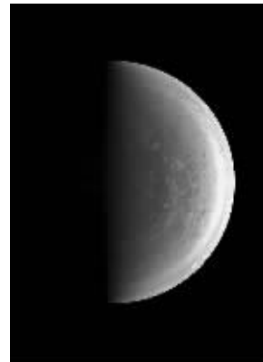
“朱诺号”拍摄的木星近照