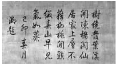
乾隆为《早春图》题诗

乾隆帝25岁登基,在位六十年,禅位后又任三年零四个月太上皇,实际行使国家最高权力长达六十三零四个月,他在位期间清朝还达到了康乾盛世以来的最高峰。权力、金钱、地位都至上,乾隆收藏的奇珍异宝不计其数,有的是从祖父那里继承下来的,有的是来自臣仆的贡献,他毕其一生的搜集所得称得上前无古人、后无来者。据了解,在全盛时期的清代宫廷收藏中,藏品约有10000件以上,其中晋唐宋元书画2000件,明代书画2000件。