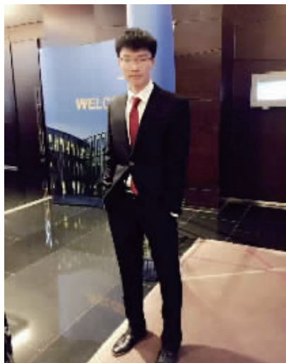
河海大学学生文科 通讯员供图