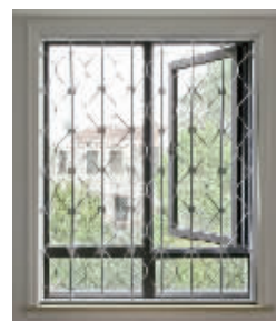
▲防盗窗的室内拍摄图

快报易购推出的新型折叠防盗窗，深得广大用户的欢迎。这款新型折叠防盗窗是具有国家发明专利产品(专利号:ZL021109176)，拥有先进技术，设计新颖、独特，制作工艺精良，外观典雅超凡，内置安装，自由开启，视线毫无遮挡。防盗、护童、消防、方便性能高。