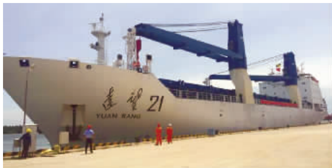
装载“长征五号”的轮船抵达海南文昌清澜港

昨天,我国最大推力运载火箭长征五号,已经安全运抵海南文昌清澜港,随后长征五号火箭在完成一系列装配和测试工作后,将于今年11月择机在中国文昌航天发射场实施首次发射任务。