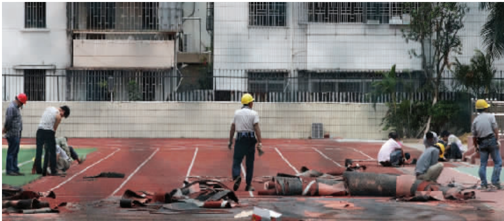
铲除有毒的塑胶跑道 资料图片

记者1日从教育部获悉,根据各省市区上报的排查情况,目前,全国中小学共有塑胶跑道68792块,其中2014年后新建的18977块,目前正在建的4799块中已停建2191块,铲除了93块。