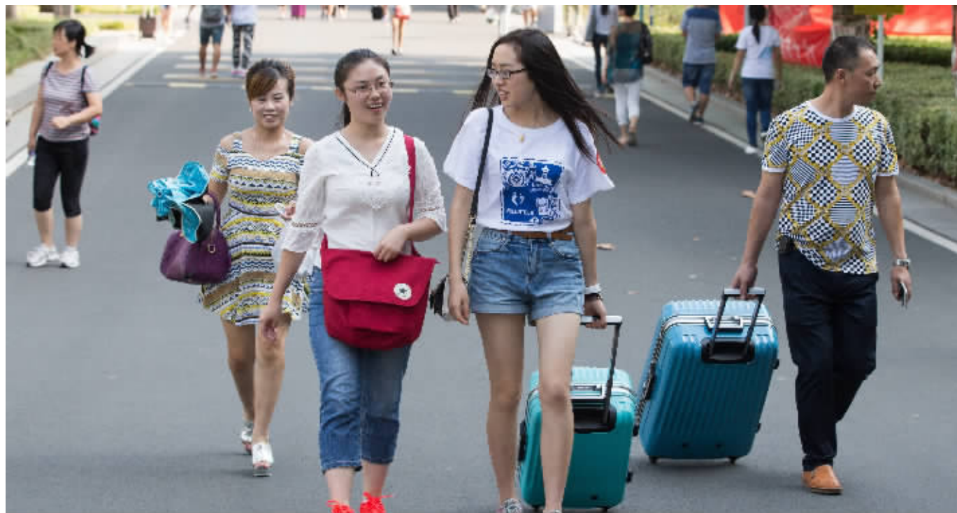
南大新生报到

现代快报/ZAKER南京记者 金凤 刘静妍 俞月花 姜振军 见习记者 陈光 邱骅悦 通讯员 储启广 见习记者 吉星(摄著名图片外)