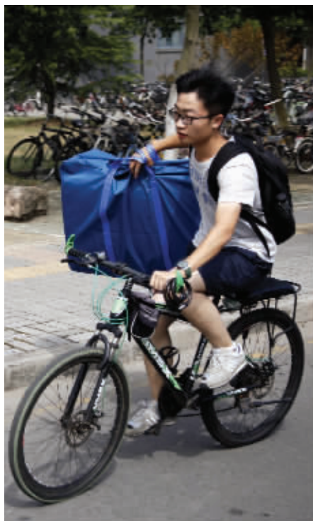
东大新生骑车购买生活用品