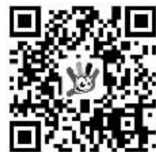
扫描上方二维码 畅玩手游彩

进入8月份以来,手游彩的中奖喜讯密集传来,旗下几大玩法齐齐发力,为彩民联手奉献了众多20万、30万级别的大奖。这不,镇江和南京两位魔力四射大奖得主,先后来到省体彩中心兑奖大厅领走了属于他们的幸运。