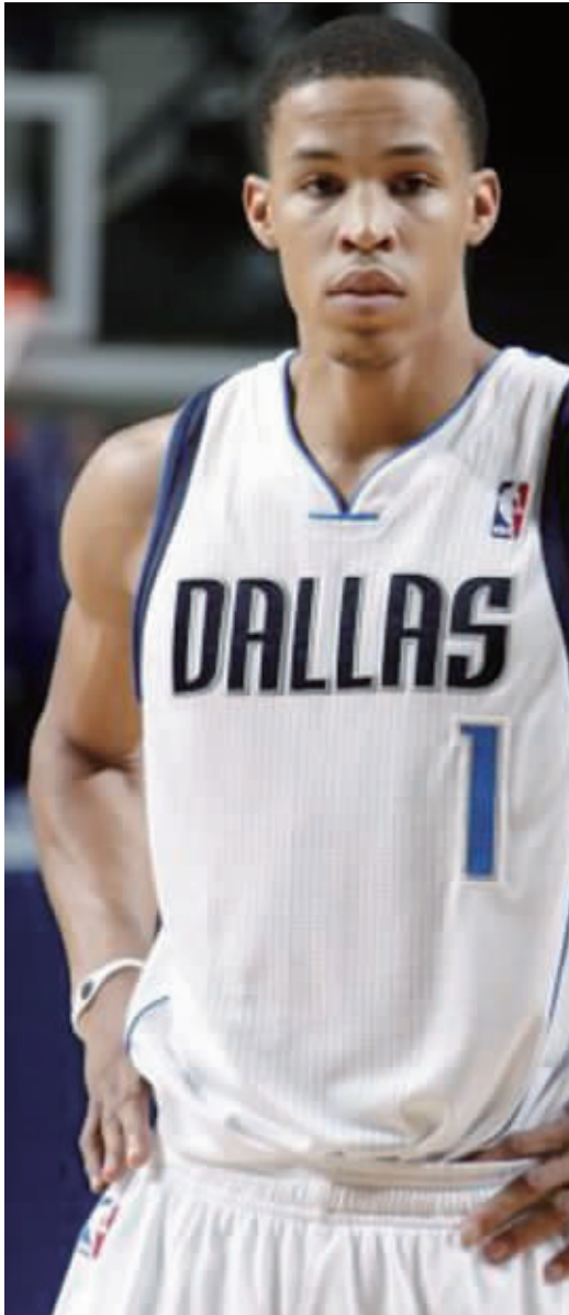
康宁汉姆球风非常彪悍