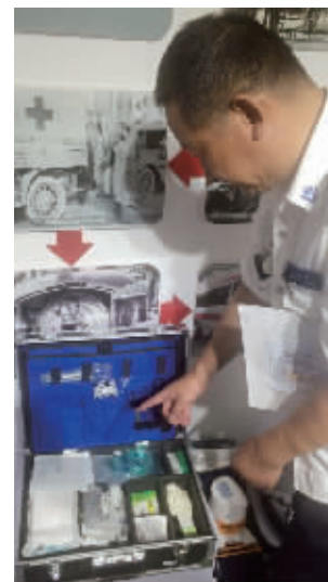
急救箱里有几十件物品

据悉,该体验馆采取省市共建模式,依托南京市急救中心建设。全馆集体验、学习、教学培