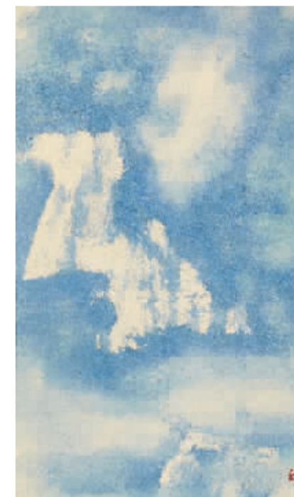
天边的云·喜马拉雅1