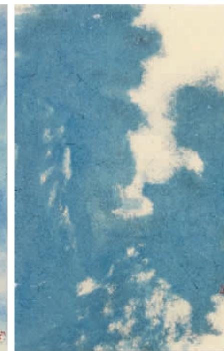
天边的云·喜马拉雅2