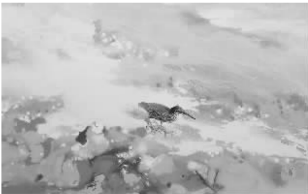
旷野系列——阳光沙迹