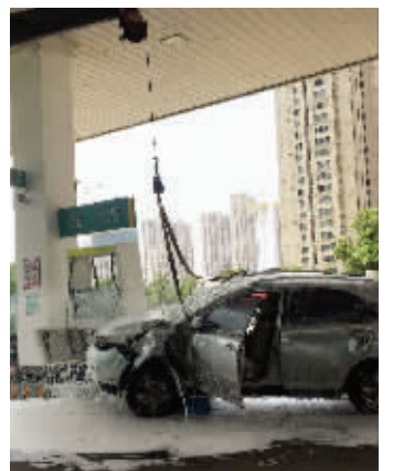
救援现场

台加油机,直到顶在加油台上才停下来。此事故共造成一人受轻伤,两车受损,一台加油机损坏,经济损失约10多万元。