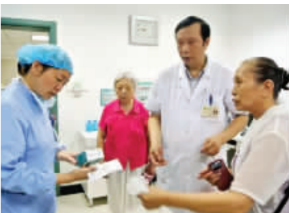
孔奶奶(右)将两盒人血白蛋白交给医务人员