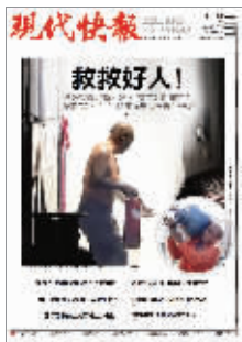
昨日快报相关报道版面