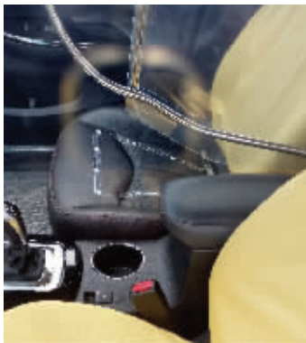
出租车乘客座位上装有感应片