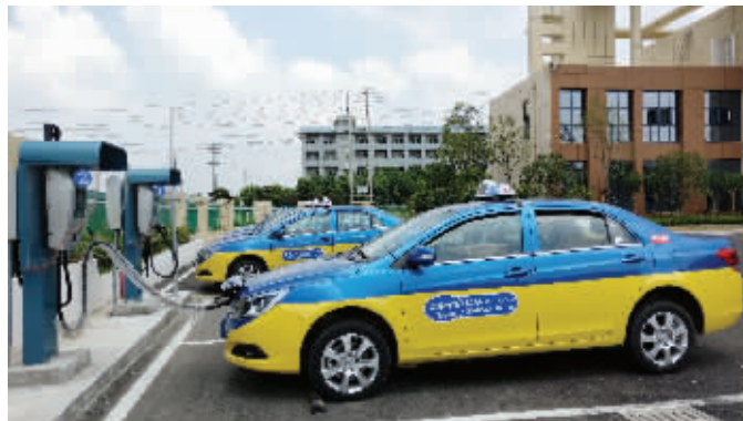
新能源出租车在充电