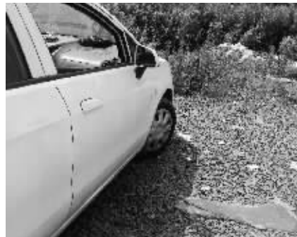
副驾驶边的车窗被砸，一辆车的右后门还被刻上英文字母

快报讯（记者 蔡梦莹）“你的车也被砸了！”昨天早上6点多，江宁淳化街道后梅村的李先生刚起床，就听到一个坏消息，他停在村北侧的汽车被砸了。据村民统计，同样遭殃的共有21辆车。到底是谁干的？村民议论纷纷。目前，警方仍在调查中。