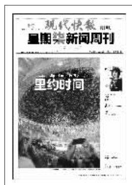
上期星期柒新闻周刊封面