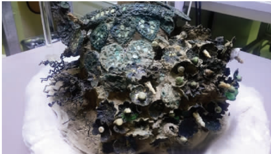
快要修复完毕的萧后冠