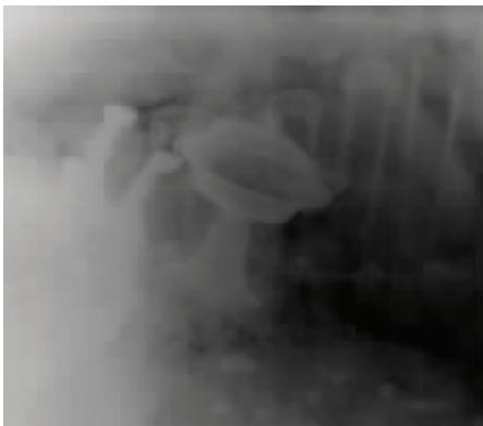
通过X光透视技术探查与分析,发现4根金属发钗