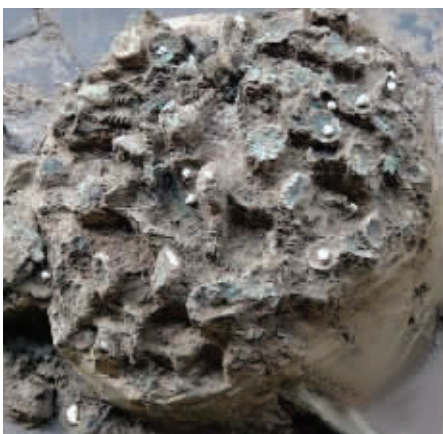
刚出土时的萧后冠 资料图片