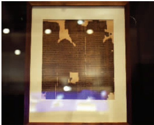
古埃及《亡灵书》残片