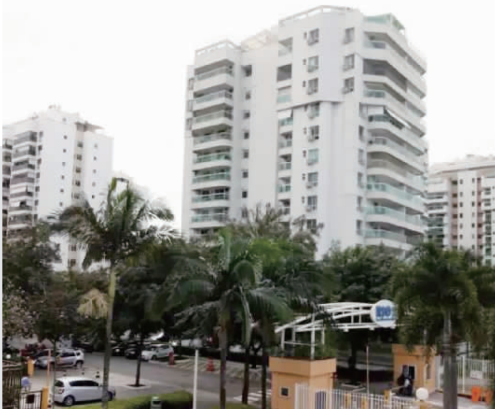
里约的中高档公寓