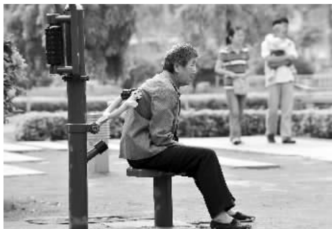
今后,南京老城区的健身场地将越来越多

不时加围挡,到底在挖什么?张昭介绍,地下开挖其中一种情况就是铺设、维护水电气管线。