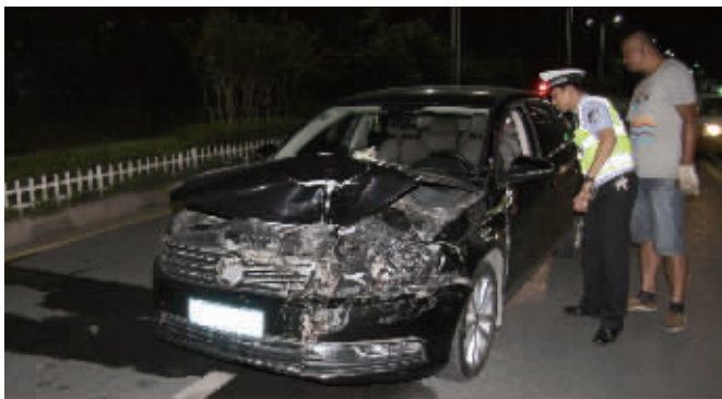
轿车车头严重变形