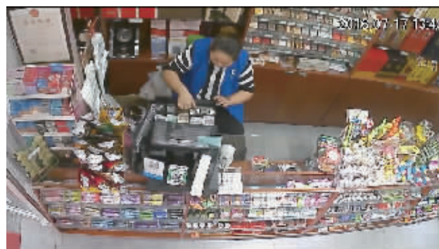
没有客人结账,姜某却打开了收银机

近日,南京一家超市盘库时发现,少了近10万元货物。超市没有任何被盗迹象,而且这么多货物也很难一下拖走而不被发现,到底怎么回事?秦准警方介入调查后真相大白,原来是收银员动了手脚,货物没少,少的是钱。