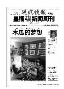
上期星期柒新闻周刊封面