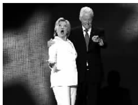
当地时间2016年7月28日,美国费城,民主党全国大会落幕,希拉里接受民主党总统候选人提名。