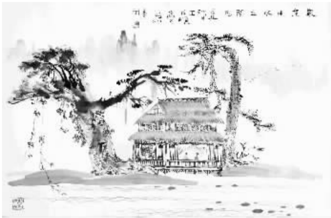
王永顺《家在山水之间》