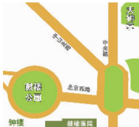
明代钟楼在鼓楼西南 制图 俞晓翔