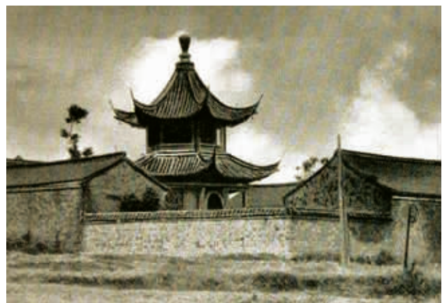
大钟亭旧影 本版图片除署名外均为资料图片