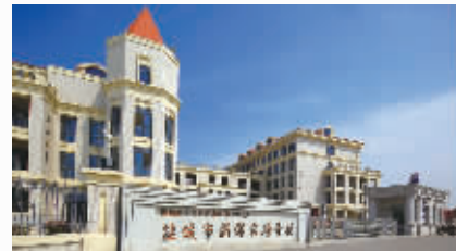
新洋实验学校建成使用

累计救助困难群众2800多人，实施再就业援助430人，办理爱心助保315人，帮助群众申请小额贷款540万元。先后建成启用新洋实验学校、新洋卫生服务中心、新洋污水处理厂等重点民生实事项目，新建社会管理综合中心、省级标准化司法所。