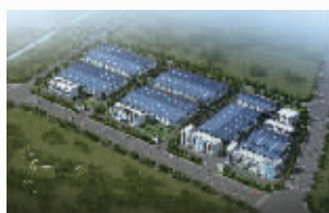
科技创业园鸟瞰图