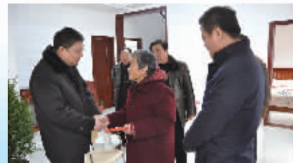
慰问活动常态化开展