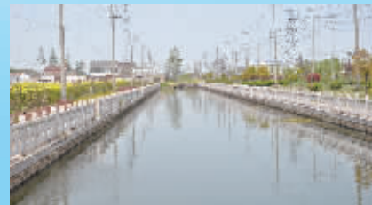
村庄环境整治一新