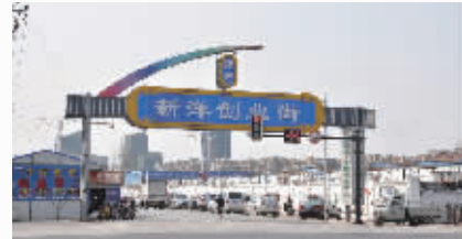
新洋创业街圆致富梦