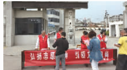
党员志愿者开展政策法规宣传活动