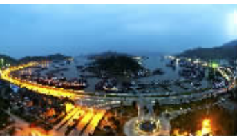
线路提供:南京金陵国际旅行社 L-JS01500

线路名称:H68象山松兰山海滨浴场、余姚浙东小九寨芝林、四明山高山森林激情皮筏漂流、宁波中心惊驾路海鲜美食一条街纯玩2日 发班日期:7月每周二、四、六 价格:398元/人