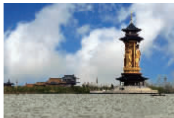
路漂来鸟语花香,心旷神怡。一路佳景美不胜收。

【溱湖森林皮筏漂流】时而险峰、蓝天、白云倒映、水浅处清澈见底、水深处如翡翠碧玉,鱼虾嬉戏其中,一