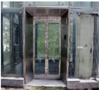
电梯门紧锁,电梯上能看见砖透