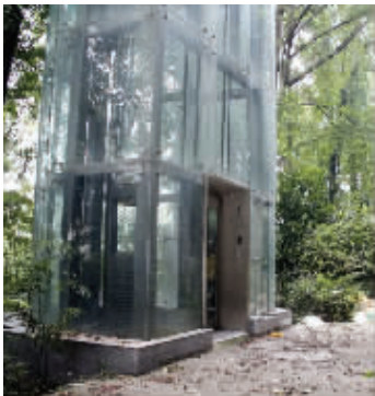
电梯井常年积水,轿厢升在半空中