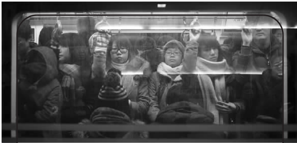
北京拥挤的地铁10号线