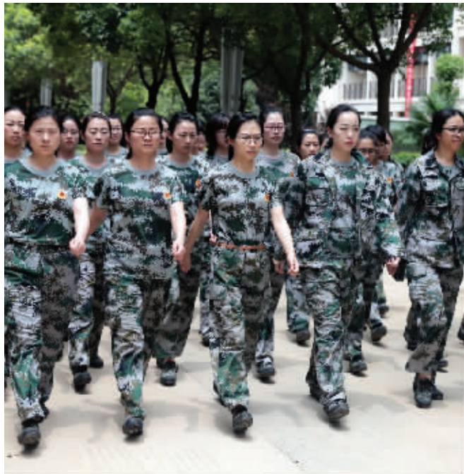
新晋女城管正在进行岗前军训