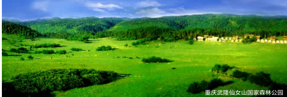
重庆武隆仙女山国家森林公园

从《满城尽带黄金甲》里,刺客俯身冲杀的经典画面,成为张艺谋唯一钦定的外景拍摄点;到《变形金刚4》里,擎天柱大战机械龙的惊险打斗,被导演迈克尔·贝盛赞为“地球最美的地方之一”;2014年它再次成为了《爸爸去哪儿》里,那个仿若世外桃源的绝美仙境;这里,就是重庆武隆。