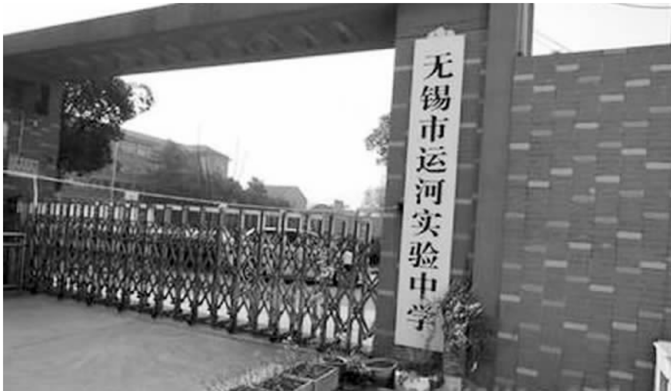
被指“天价高中”的无锡市运河实验中学;小图为家长交费回单截图(照片来自网络,请作者联系我们领取稿费)