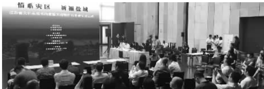
“情系灾区 祈福盐城”现场义卖活动

江苏省文化厅巡视员高云告诉记者:“此前,江苏书画家一直有向灾区人民捐赠的传统。画如其人,我们一直在倡导人正画才正,人好画才好。这次灾害发生在自家,我们江苏省内200多位画家在这么短的时间内捐赠了这么多作品,可以说是一个奇迹,体现了江苏书画家的素质、爱心和奉献精神。这次捐赠的