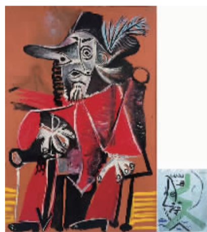
2009年拍出的毕加索《火枪手》(左)与此次展览作品《火枪手》尺寸对比图