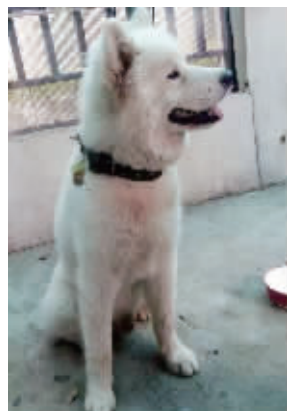
走失的萨摩耶

快报讯(通讯员 秦公轩 张鑫 记者 陶维洲)最近南京的大雨给市民出行造成麻烦,连狗狗都受到影响,一条小狗在大雨里迷了路。据狗的主人称,该小狗原来很认路,出去都能自己回家,哪想到雨天就迷路了。不过幸好小狗是办了狗证的,民警一扫项圈芯片的信息,就联系上了失主。