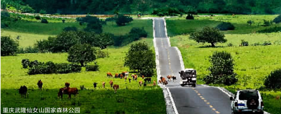
重庆武隆仙女山国家森林公园

有一条行程,去年一个暑假,千余名南京游客怀着忐忑的心情前往,结果令他们喜出望外的零投诉,99%的游客用“超值、惊喜、震撼”来评价这条行程。